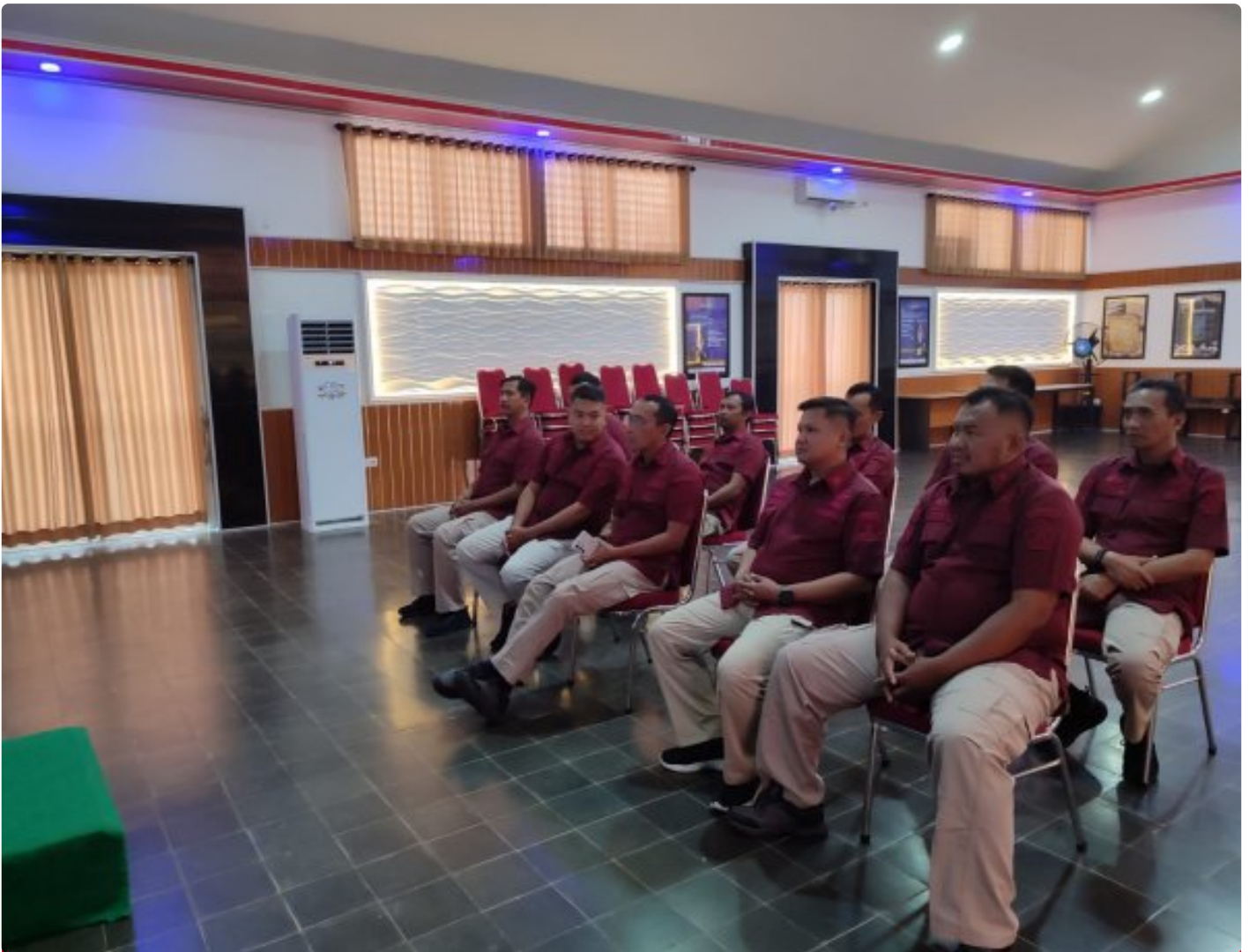
Bangun Personal Branding ASN, Lapas Besi Hadiri Webinar Series 6

CILACAP – Petugas Lapas Kelas IIA Besi Nusakambangan menghadiri kegiatan Webinar Series 6 yang diselenggarakan oleh Badan Pengembangan Sumber Daya Hukum (BPSDM) dan HAM bertempat di Aula Wijaya Kusuma, Kamis (24/10/2024).